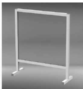
Beispiel 1: Thekenaufsatz mit transparentem Fenster und Durchreiche.

Unsere individuellen Raumtrennsysteme bieten Ihnen vielfältigste Möglichkeiten: vom einfachen Thekenaufsteller bis zum individuellen Raumkonzept. Wir realisieren für Sie schnell und zuverlässig die unterschiedlichsten Lösungen - ganz nach Ihren Anforderungen!