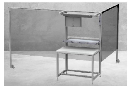
Beispiel 3: Abschirmung für Waren- oder Dokumentenübergabeflächen mit Durchreiche.

Sprechen Sie uns an - wir beraten Sie gern!